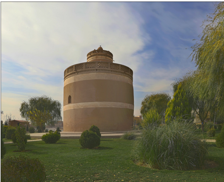
برج کیوترخانه جوی آباد قدیم:

نشانی: خیابان پروفیسور میردامادی بوستان مهر