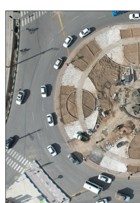
میدان شهید آیت الله رئیسی