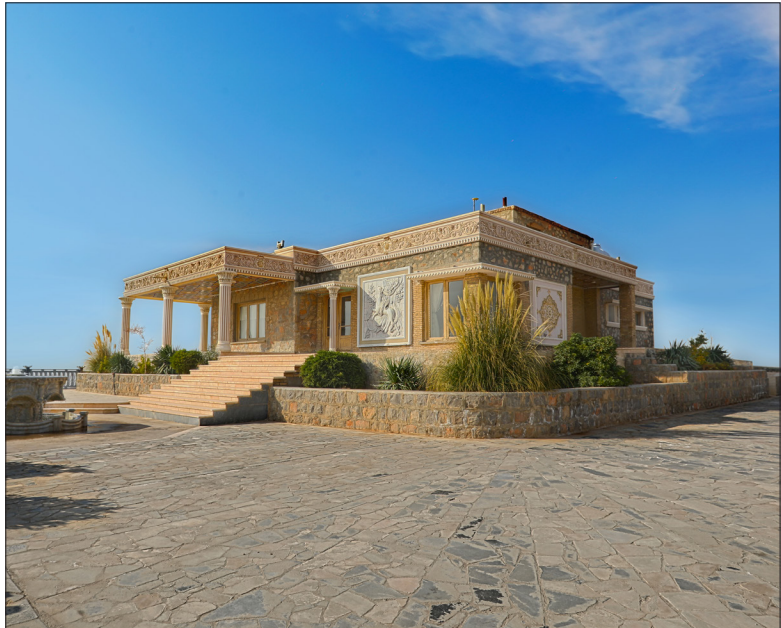
منطقه گردشگری بام سبز در دل باغات خمینی شهر با چشم‌انداز زیبا شامل:

باغ ایرانی/عکسخانه (موزه عکس‌های تاریخ منطقه)/نگارخانه/نشانی: میدان امام رضا، خیابان کوهسار، حاشیه کانال آب به سمت بلوار غدیر