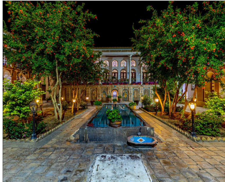
خانه مجیر/بنیان‌گذار: ابوالحسن خان مجیر

دوره تاریخی: قاجار/موزه‌های مشاهیر و اسناد شهرستان خمینی شهر در این خانه دایر است نشانی: خمینی شهر، میدان شهدا، خیابان مدرس، کوچه شماره ۱۶، شهیدان مجیری