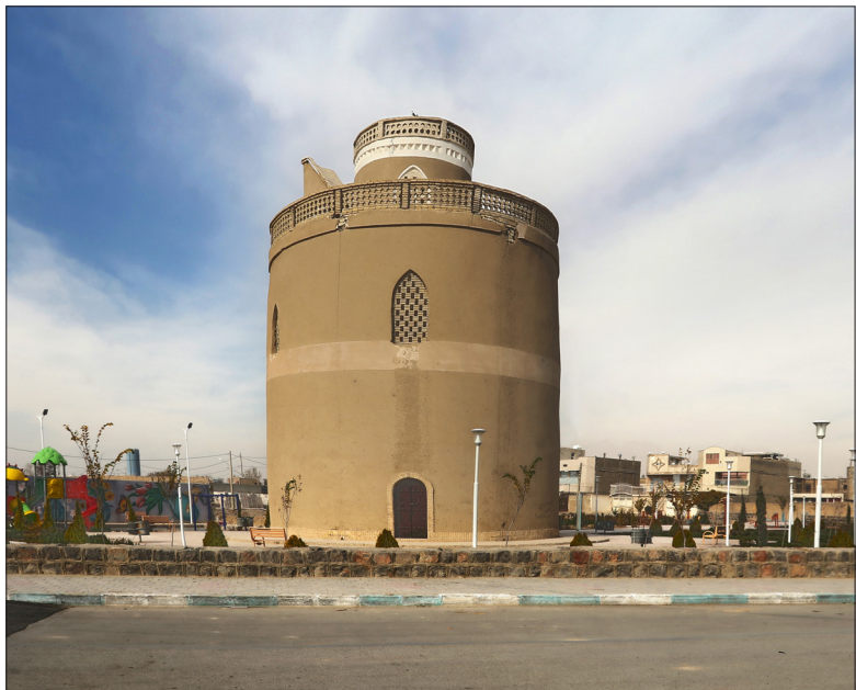
برج کیوترخانه دستگرد:

دوره تاریخی: قاجار/موزه‌های مشاهیر و اسناد شهرستان خمینی شهر در این خانه دایر است نشانی: خمینی شهر، میدان شهدا، خیابان مدرس، کوچه شماره ۱۶، شهیدان مجیری