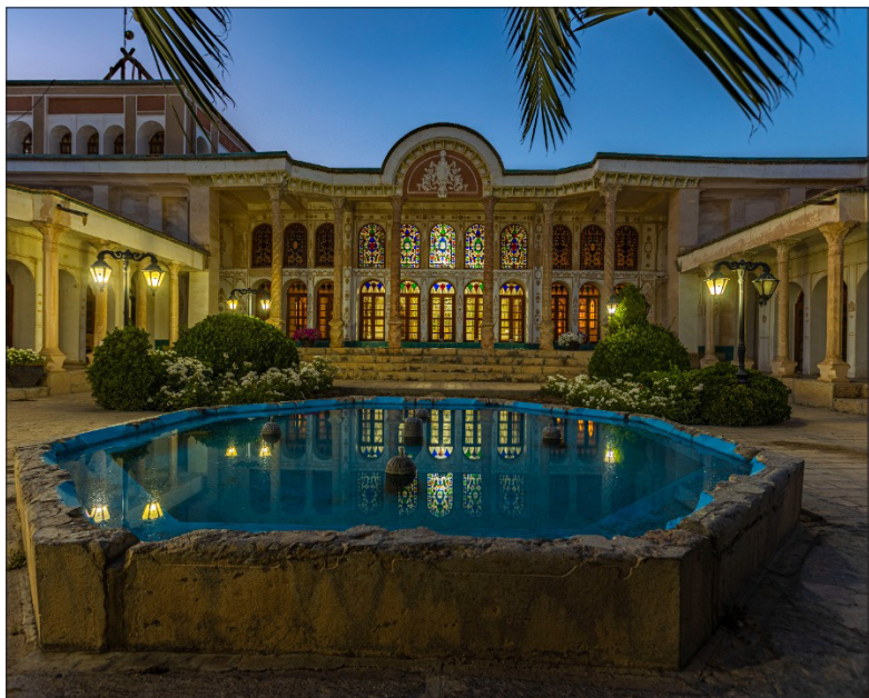
خانه سرتیپ امینی سده‌ی/بنیان‌گذار: سرتیپ محمد حسین خان امینی سده‌ی/دوره تاریخی: قاجار

نشانی: خمینی شهر، ابتدای خیابان شریعتی شمالی، از سمت چهارراه، کوچه شماره ۵۲ شهید اکبر علیشاهی