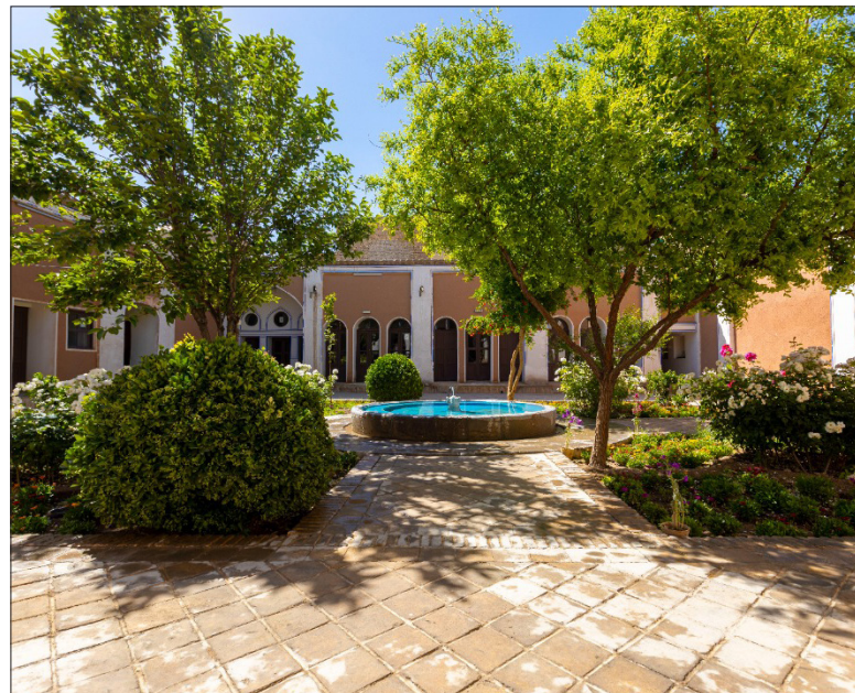
خانه تاریخی زهتاب/خانه هنرمندان/دوره: قاجار

نشانی: خیابان شهید فهمیده، ضلع شمالی امام زاده سید نجم‌الدین