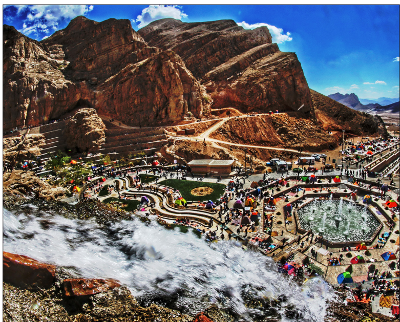
منطقه گردشگری لادر/منطقه کوهستانی دارای چشمه، همراه فضای سبز و سکوه‌های نشیمن

نشانی: خمینی شهر، خیابان شریعتی جنوبی خمینی شهر، بلوار شهدای خوزان