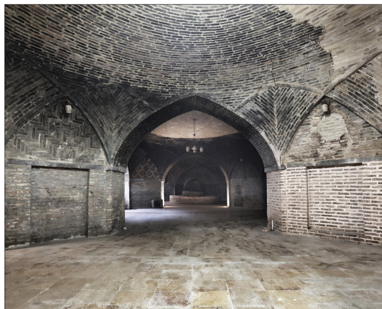
عصارخانه ورنوسفادران/دوره تاریخی: صفویه

نشانی: خیابان امام شمالی، میدان عصارخانه