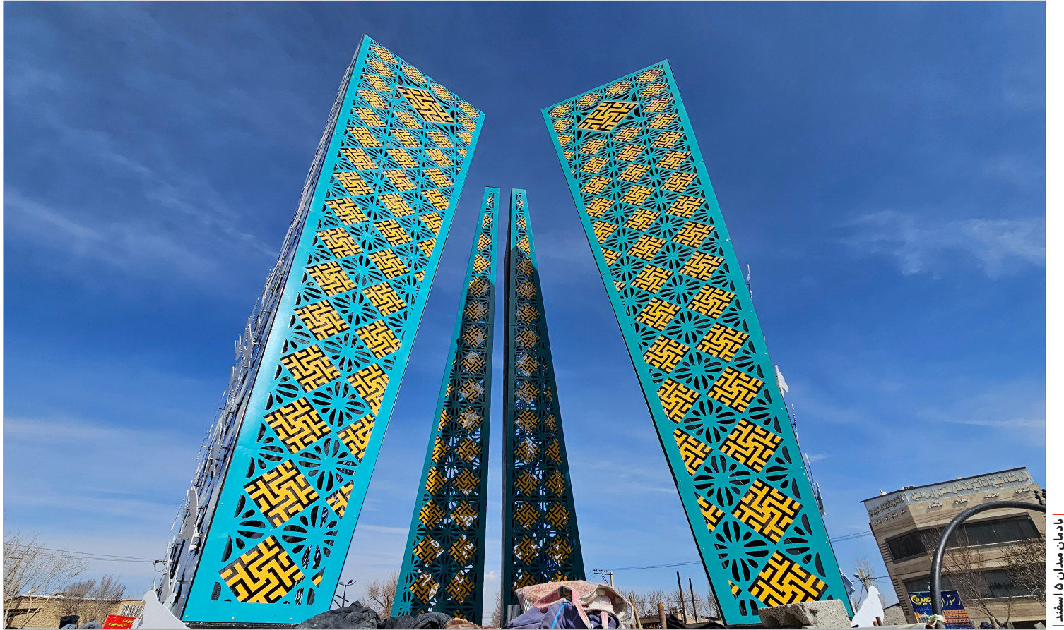
یادمان میدان ۱۵ اسفند

گزارشی از اهم اقدامات مدیریت شهری خمینی شهر در سالی که گذشت