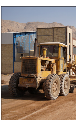
بلوار خلیج فارس

مدت‌ها بود گلایه بسیاری از شهروندان نبود سرویس بهداشتی عمومی در سطح شهر بود. احداث سرویس‌های بهداشتی دوشنبه‌بازار، چهارشنبه‌بازار و پارک ساحلی تا حدود زیادی پاسخ‌گوی این مطالبه مردمی بود. سرویس‌های بهداشتی دوشنبه‌بازار و چشمه دارد (دو چشمه فرنگی و