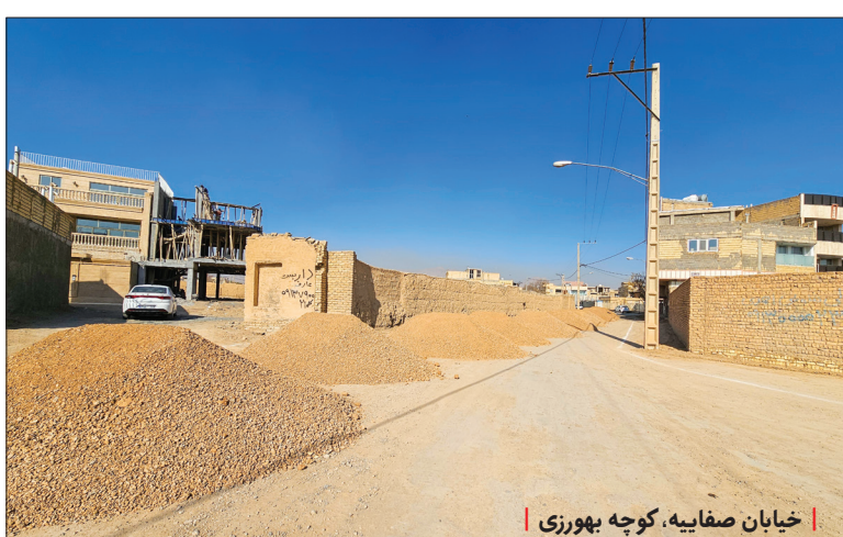
خیابان صفائیه کوچه بهروزی