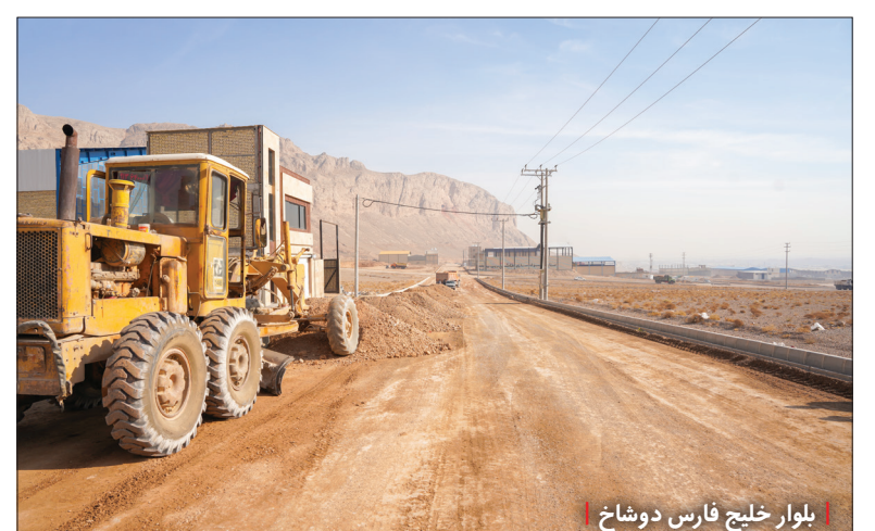
بلوار خلیج فارس دوشاخ