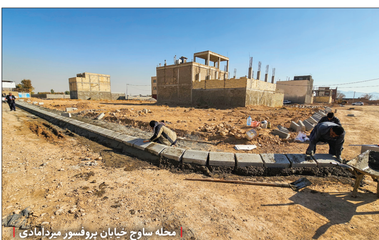
محله ساوج خیابان پروفیسور میردامادی