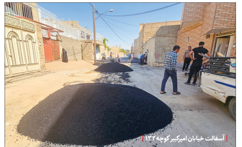
آسفالت خیابان امیرکبیر کوچه ۱۳۲