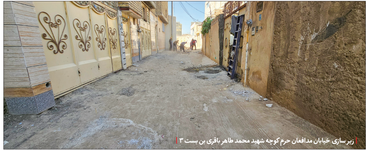
زیرسازی خیابان مدافعان حرم کوچه شهید محمد طاهر باقری بن بست ۳