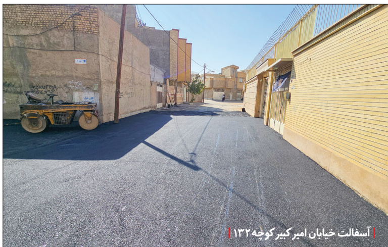
آسفالت خیابان امیرکبیر کوچه ۱۳۲