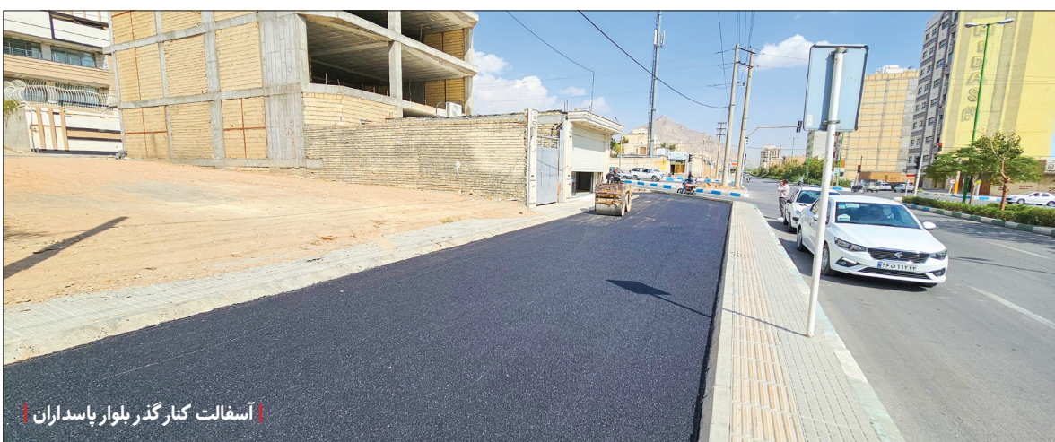
آسفالت کنار گذر بلوار پاسداران