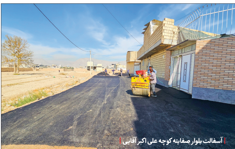
آسفالت بلوار صفائیه کوچه علی اکبر آقایی