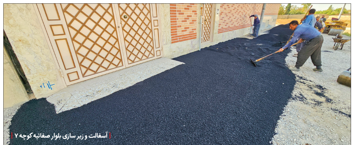
آسفالت و زیرسازی بلوار صفائیه کوچه ۷