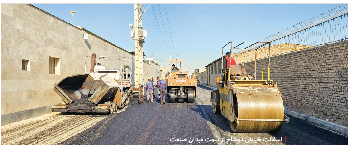
آسفالت خیابان دوشاخ از سمت میدان صنعت