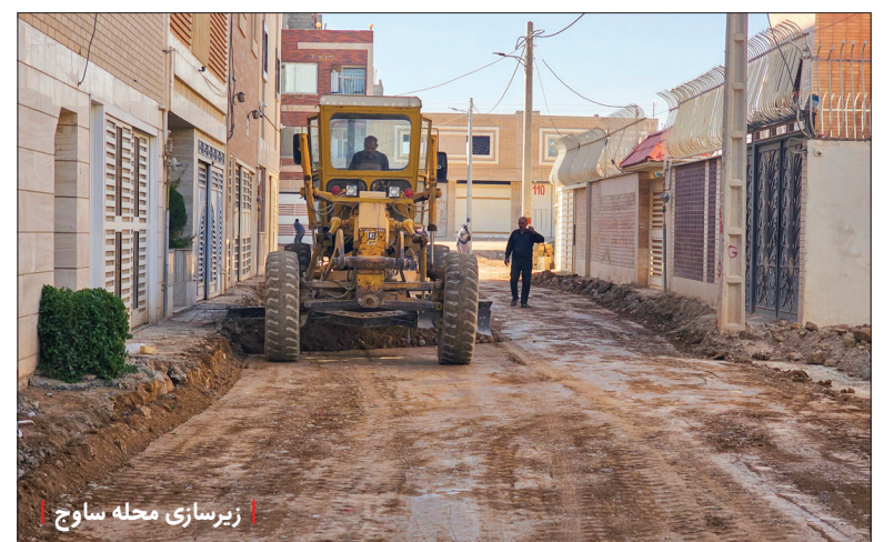
زیرسازی محله ساوج