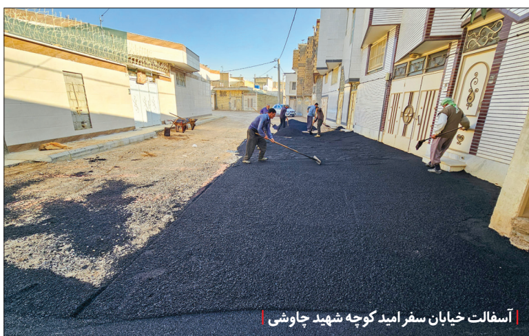
آسفالت خیابان سفر امید کوچه شهید چاوشی