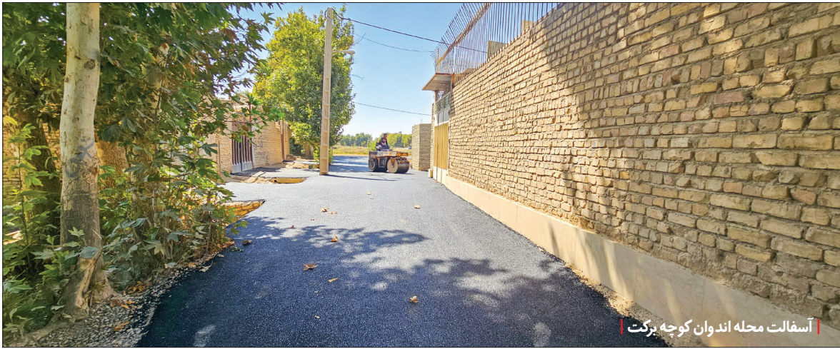
آسفالت محله اندوان کوچه برکت

عبور ماشین آسفالت از کوچه پس کوچه های شهر... از بلوار پاسداران تا جوی آباد جدید و این یعنی تمرکز زدایی و توزیع عادلانه خدمات و امکانات در نقاط مختلف شهر