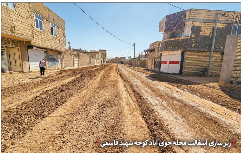
زیرسازی آسفالت محله جوی آباد کوچه شهید قاسمی