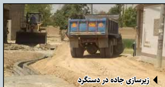
زیرسازی جاده در دستگرد