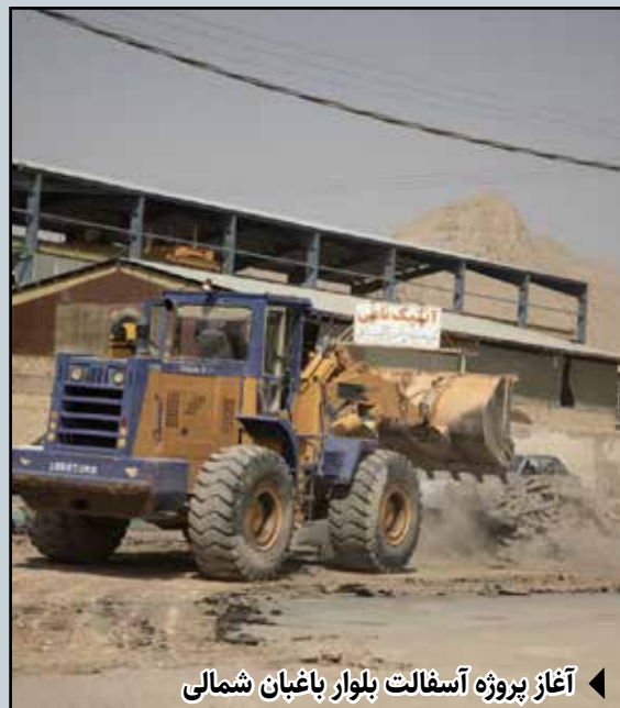
آغاز پروژه آسفالت بلوار باغبان شمالی