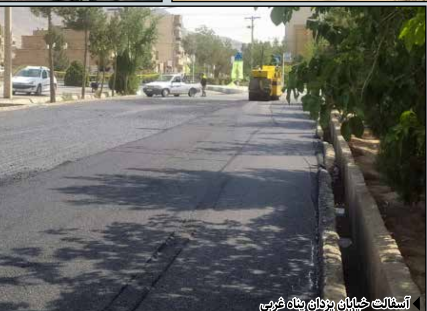
آسفالته خیابان پیوندان پناه شریب