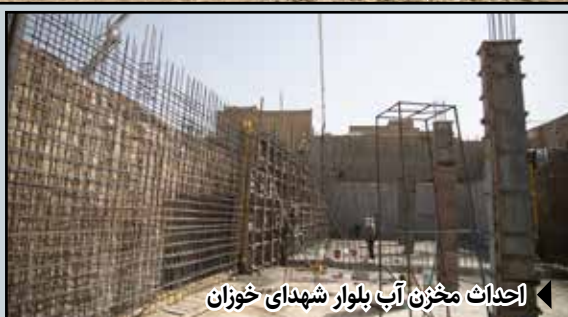
لحظات مخزن آب بلوار شهدای خوزان