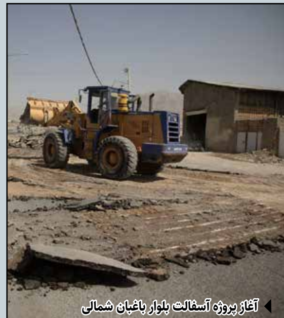
آغاز پروژه آسفالت بلوار باغبان شمالی