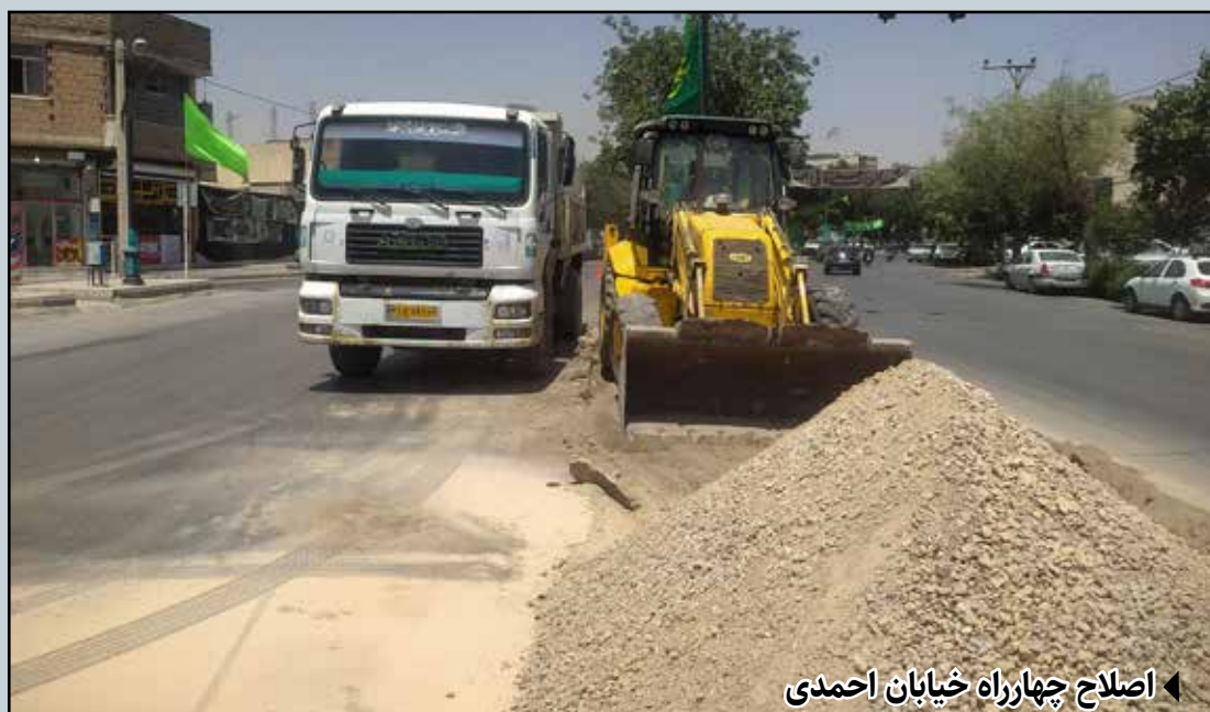
اصلاح چهارراه خیابان احمدی