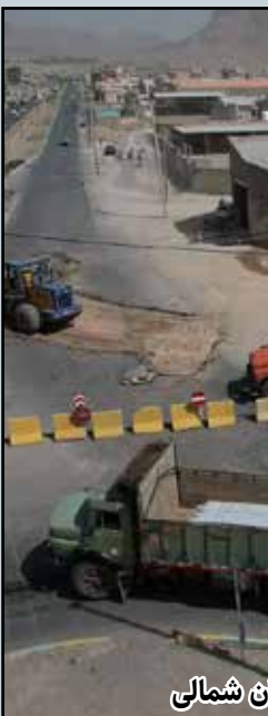
آغاز پروژه آسفالت بلوار باغبان شمالی