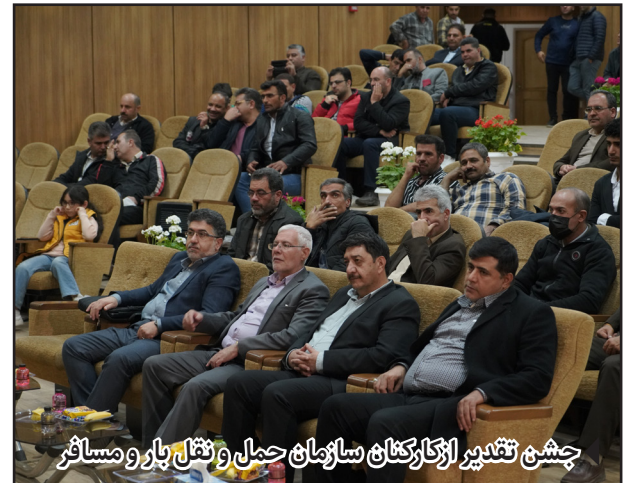
چشم تقدیر از کارکنان سازمان حمل و نقل بار و مسافر