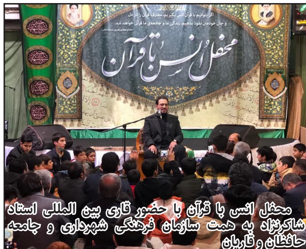
محفل انس با قرآن با حضور قاری بین المللی استان شاکر نژاد به همت سازمان فرهنگی شهرداری و جامعه حافظان و قاریان