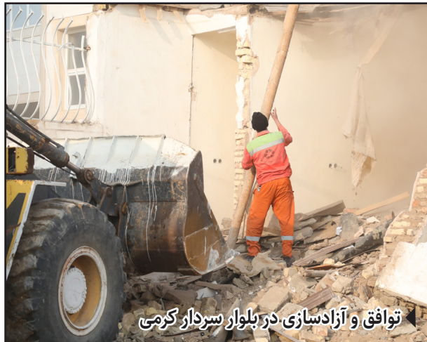
توافق و آزادسازی در بلوار سردار گرمی