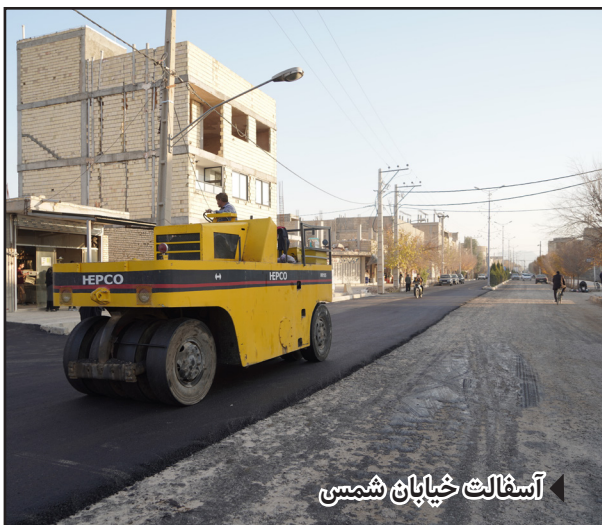
آسفالت خیابان شمسی