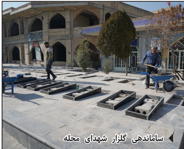
ساماندهی گلزار شهدای محله