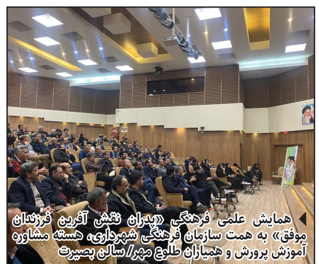
همایش علمی فرهنگی «پوران نقش آفرین فرزندان موفق» به همت سازمان فرهنگی شهرداری، هسته مشاوره آموزش پرورش و همیاران طلوع مهر / سالن بصیرت