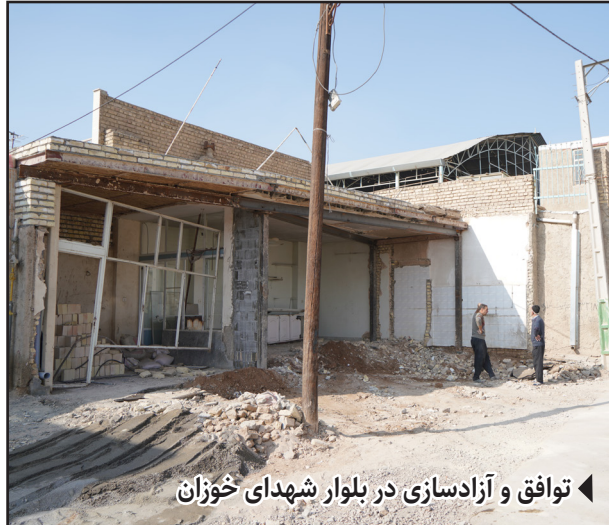
توافق و آزادسازی در بلوار شهدای خوزان