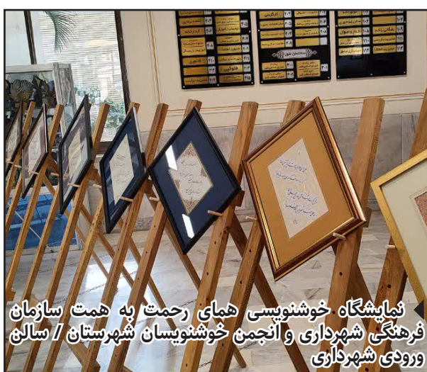
نمایشگاه خوشنویسی همای رحمت به همت سازمان فرهنگی شهرداری و انجمن خوشنویسان شهرستان / سالن ورودی شهرداری