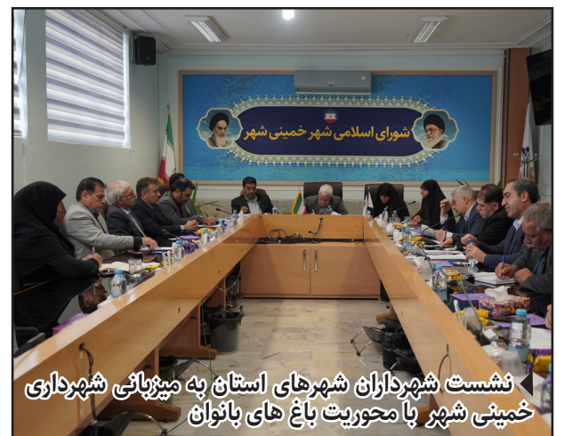
نشست شهرداران شهرهای استان به میزبانی شهرداری خمینی شهر با محوریت باغ های بانوان