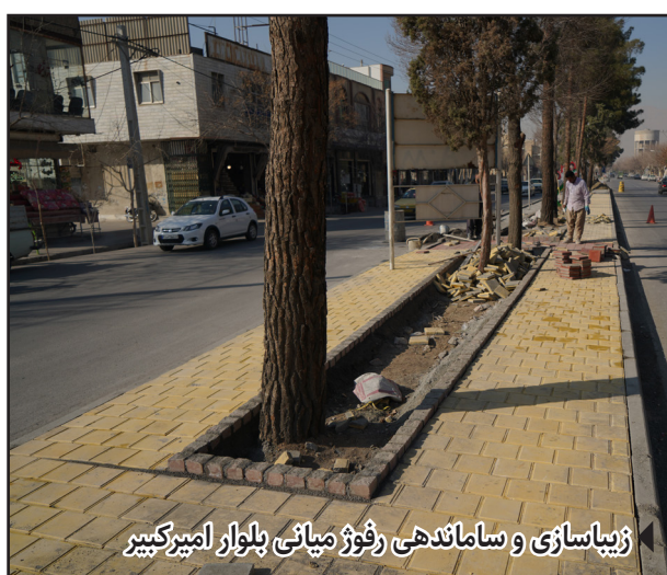
زیباسازی و ساماندهی رفوژ میانی بلوار امیرکبیر