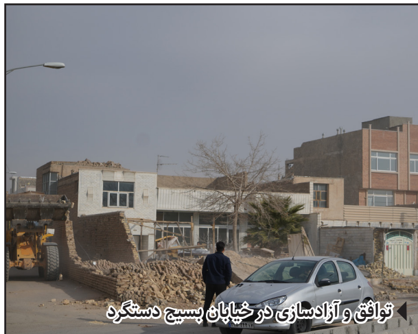
توافق و آزادسازی در خیابان پسیج دستگرد