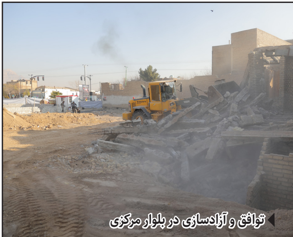
توافق و آزادسازی در بلوار مرکزی

گفتنی است دو روز پس از برگزاری نشست مذکور بازدیدی با حضور شهردار، معاون فرهنگی اجتماعی شهرداری و تنی چند از هنرمندان تئاتر، از خانه حاج هاشمی انجام شد و مقرر گردید امور باقیمانده از بازسازی این خانه تاریخی انجام و خانه نمایش تا پایان سال افتتاح گردد.