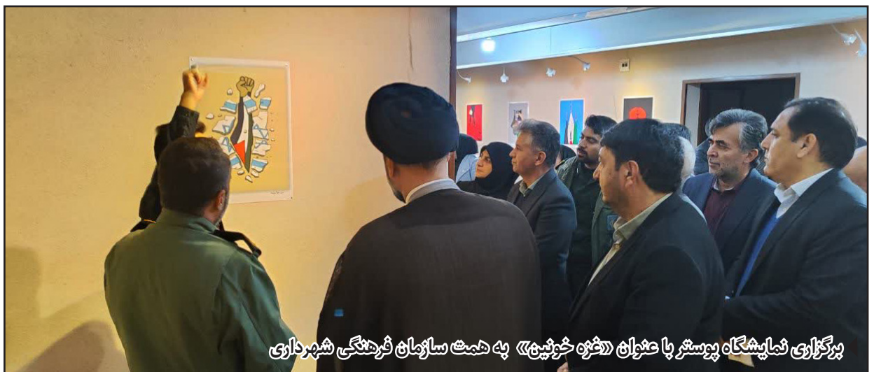
برگزاری نمایشگاه پوستر با عنوان «فره خرفیه» به همت سازمان فرهنگی شهرداری