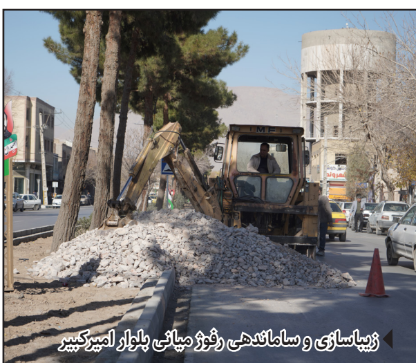
زیباسازی و ساماندهی رفوژ میانی بلوار امیرکبیر