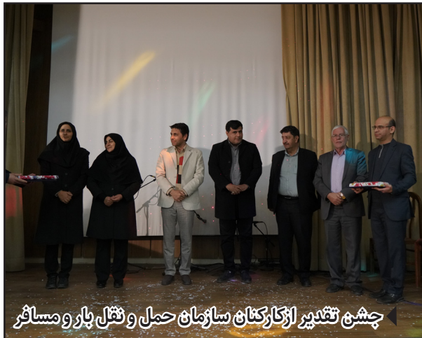
چشم تقدیر از کارکنان سازمان حمل و نقل بار و مسافر