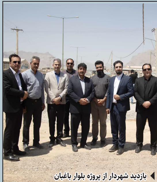
بازدید شهردار از پروژه بلوار باغبان