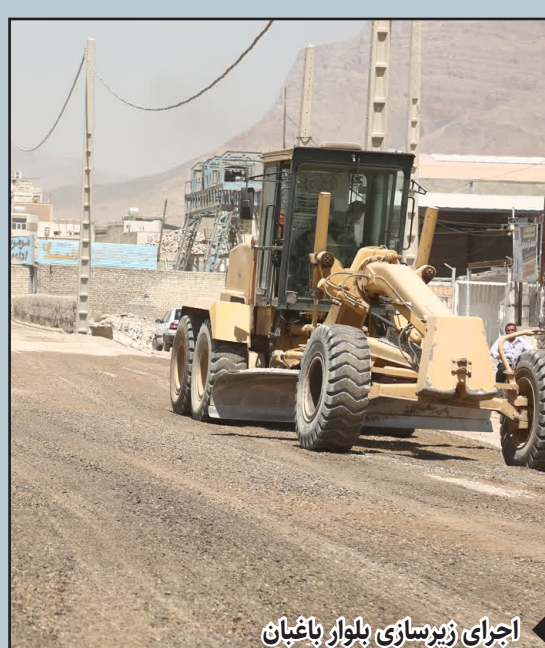
اجرای زیرسازی بلوار باغبان