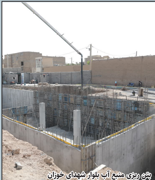
بتن ریزی منبع آب بلوار شهدای خوزان