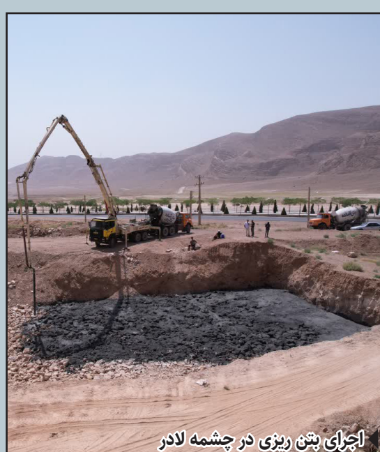
اجرای بتن ریزی در چشمه لادر

توقف یا پارک وسیله نقلیه در مکان نامناسب در کوچه و خیابان و معابر به نحوی که باعث مسدود شدن پیاده رو و ایجاد سد معبر و اتلاف وقت دیگران گردد.