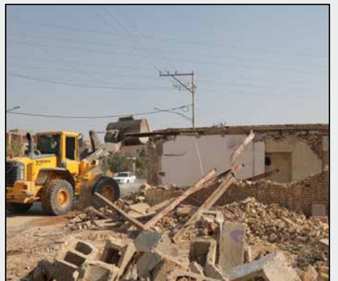
توافق، تخریب و آزادسازی در خیابان بسیج دستگرد

در گفتگوی فرصت با مدیرعامل سازمان حمل و نقل