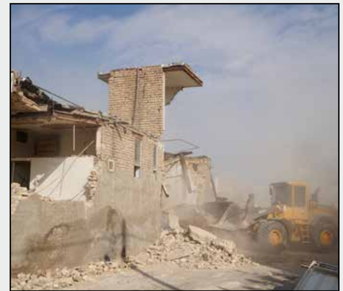
توافق، تخریب و آزادسازی در خیابان شهدای جوی آباد