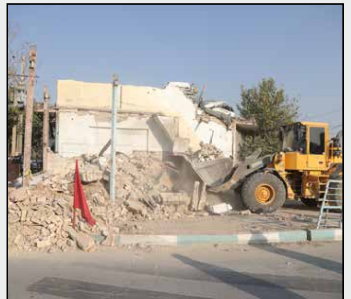
توافق، تخریب و آزادسازی در ورودی بلوار شهدای مدافع حرم به امیر کبیر