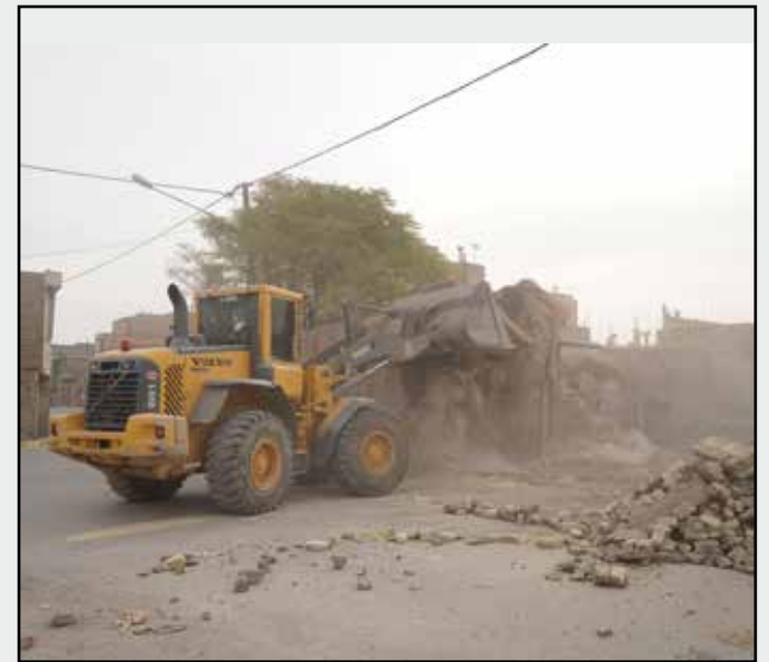
توافق، تخریب و آزادسازی در خیابان ۱۶ متری اسفریز